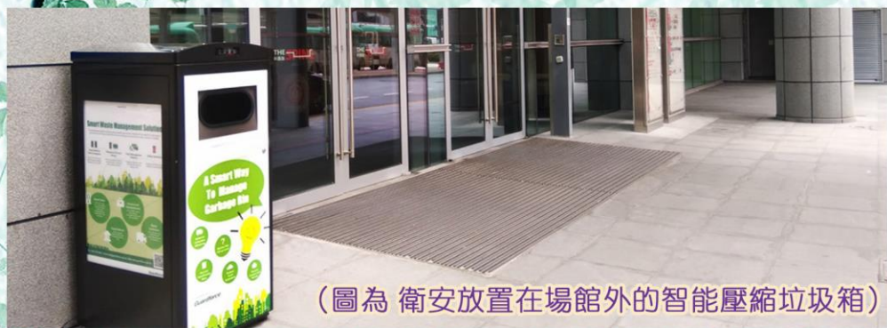
(圖為 衛安放置在場館外的智能壓縮垃圾箱)

在場館入口處擺放著衛安公司研發的太陽能壓縮垃圾箱，其內建超聲波滿載偵測及自動壓縮功能，當垃圾桶壓縮率到達85%，清潔車才出動收運——這種精準干預可減少80%垃圾清運頻次，大大提升了場館的清潔效能。